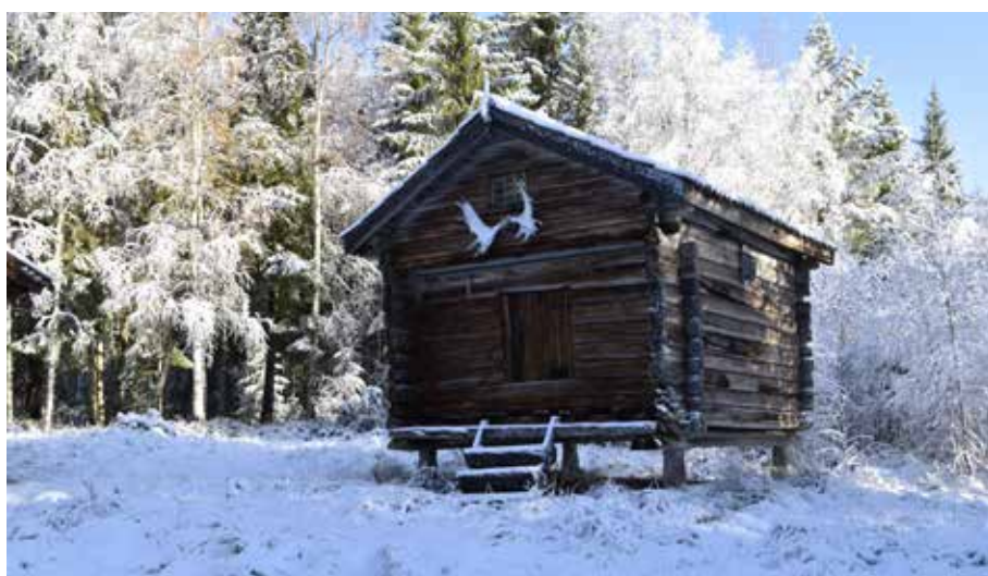
Rotanders härbre med lagg-tak och ålderdomligt blyspröjsat gavelfönster. Byggnaden är sannolikt mycket gammal. Hedby 10:5.