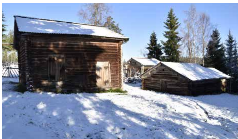
Till vänster syns ett stall av sådant slag som beskrivs i texten, utan portlider och med förhöjd foderbodsdel. Till höger syns ett ålderdomligt timrat fäjs. Myrmases eller Fors 26:2.