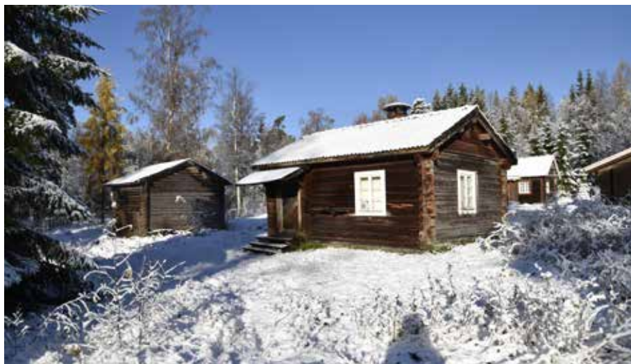
Välbevarad och ålderdomlig fäbodstuga på Ohlens, på fastigheten Hedby 6:5.