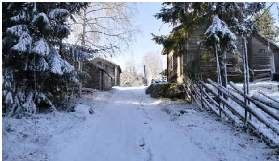
Den östra anfartern till fäbodstället är inhägnad med gärdesgårdar och omfamnas av ålderdomliga timmerhus.