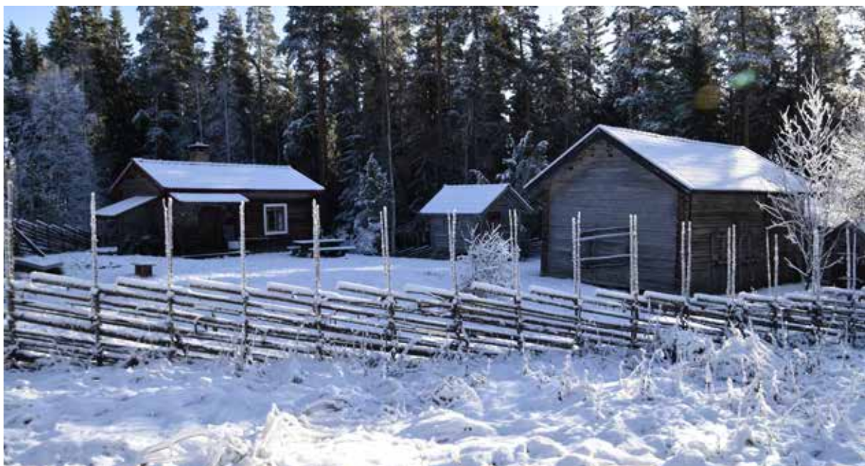
Lindomes, en välbevarad fäbodgård med ålderdomlig enkelstuga och flera äldre ekonomibygnader. Ytterdörren till enkelstugan har vackert profilhyvlat rombmönster. Fors 3:4.