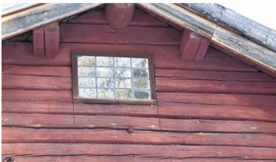
Synnerligen ålderdomligt blyspröjsat fönster på enkelstuga. Rotanders på fastigheten Hedby 10:5.