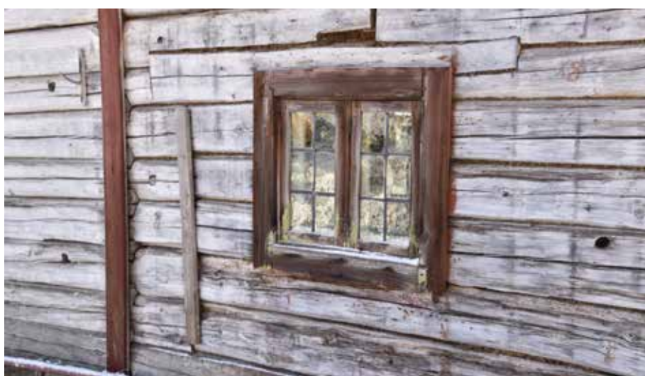
Blyspröjsat fönster av en modell som var vanlig bland annat under 1700-talet. Liknande detaljer antyder mycket hög ålder. Fäbodstugan på Dragstens på fastigheten Fors 8:9.