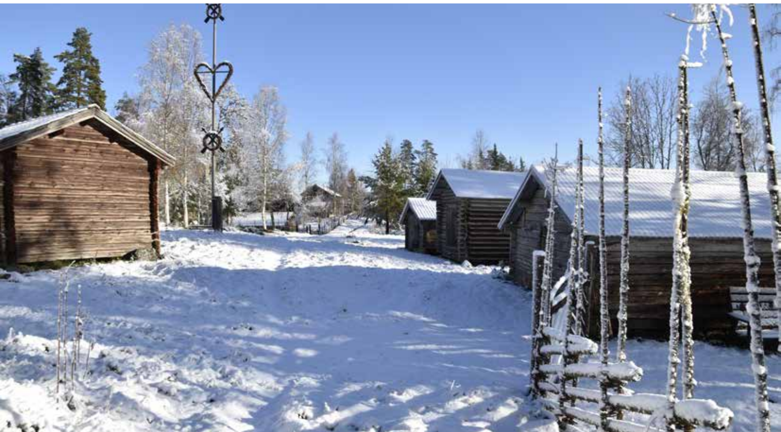
I den östra delen av Forsbodarna finns ett fätorg med majstångsplats. Flera äldre fähus angränsar till torget, som också delvis är inhägnat av gärdesgårdar. Inhägnade fägator nyttjades för att hålla djuren borta från värdefull åker- och slogmark.