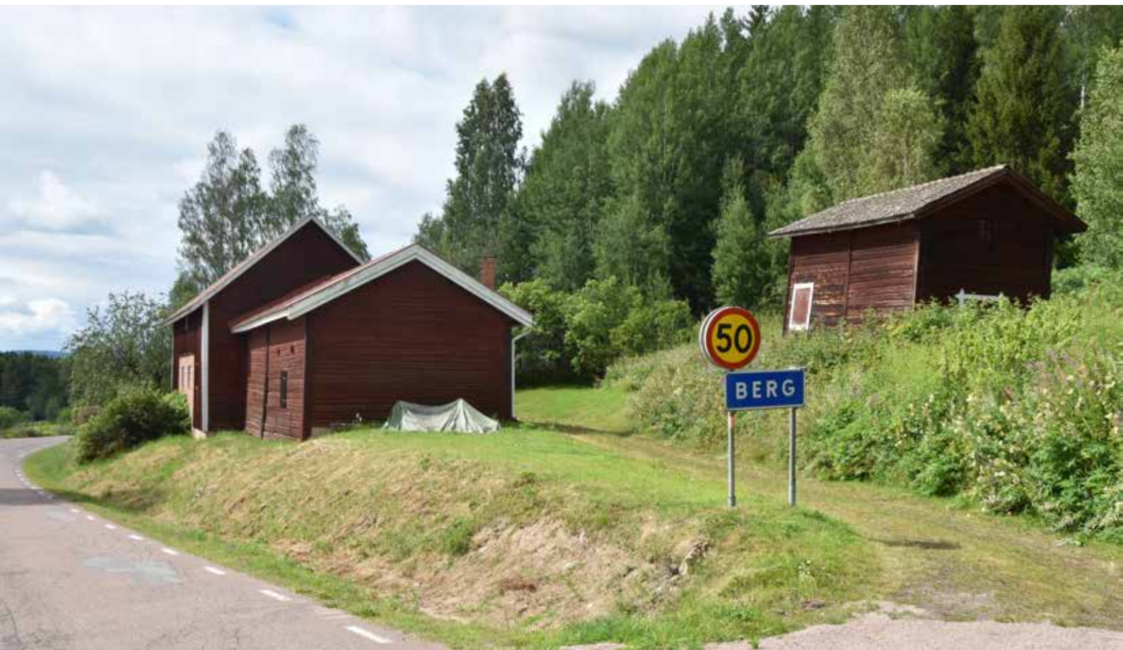
Äldre ekonomibygnader i timmer belägna intill den genomlöpande landsvägen mellan Romma och Rönnäs. De faluröda träbyggnaderna är en mycket viktig beståndsdel i kulturlandskapets karaktär.