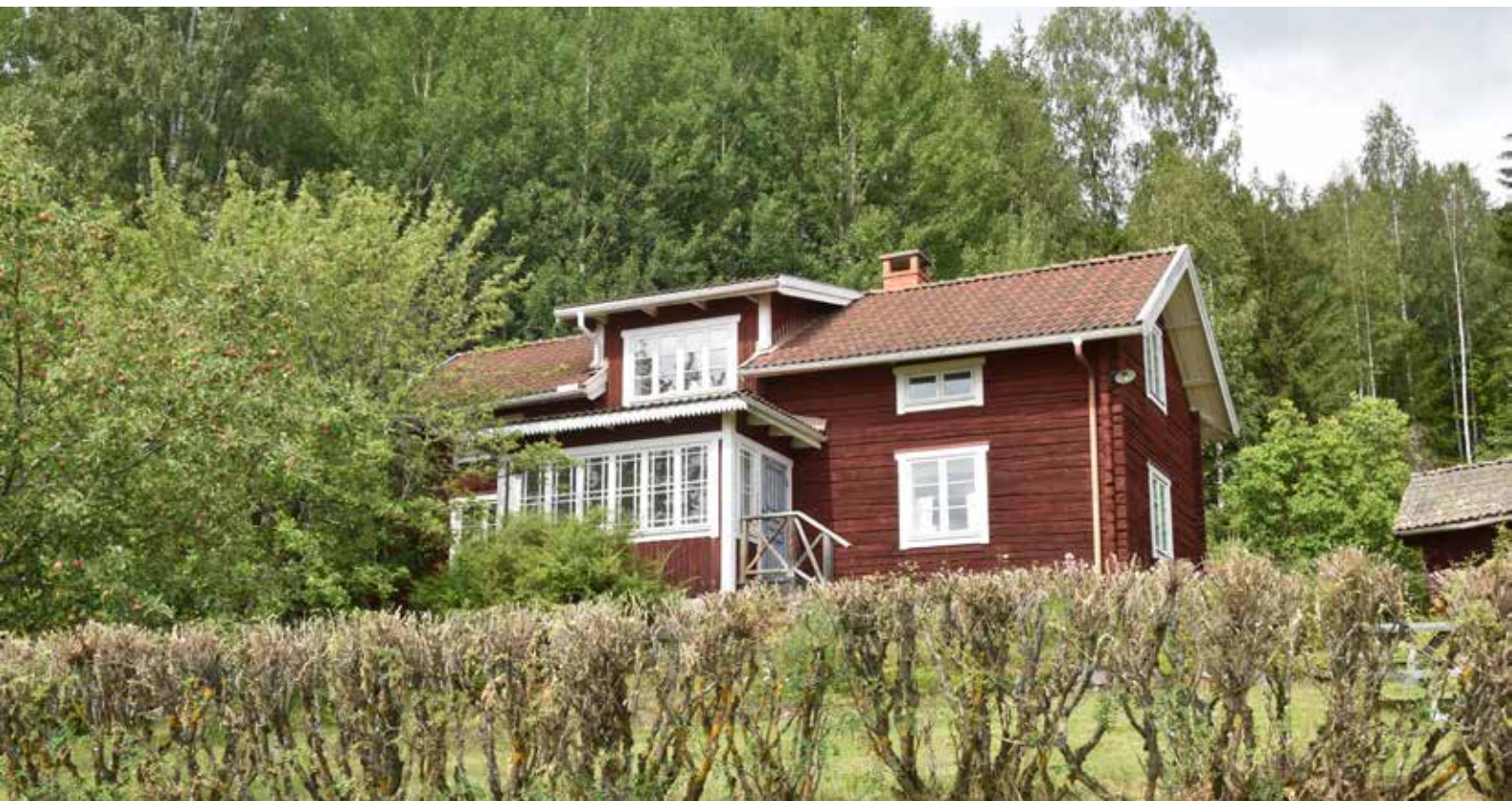
Äldre timmerhus med delvis välbevarade detaljer söder om Berg, vid landsvägen mot Västra Rönnsås. Berg 11:3.