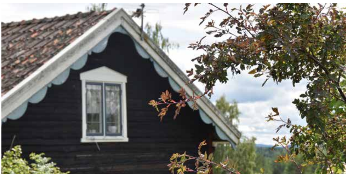
Närbild på ett av de modernistiska timmerhusen, med många detaljer mer stiltypiska för nationalromantiken. Däribland vågiga vindskivor, blyspröjsade fönster och kronskorsten. Berg 6:5.