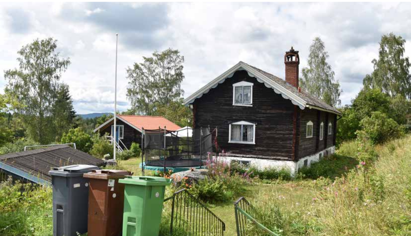
Dalamodernistiskt timmerhus med särskilt kulturvärde längs bygatan i Berg. Byggnaden kan bland annat berätta om hur timmerhuskulturen utvecklades och återaktualiserades under 1900-talet och är därför värdefull. Berg 6:5.