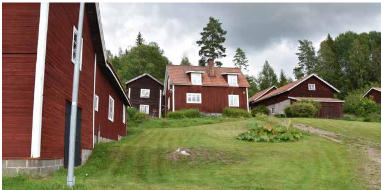
Kringbyggd gård i södra delen av Berg. Det finns många hus i byn som är uppförda under 1900-talet med röd locklistpanel och karaktäristiska takkupor. Berg 3:4.4