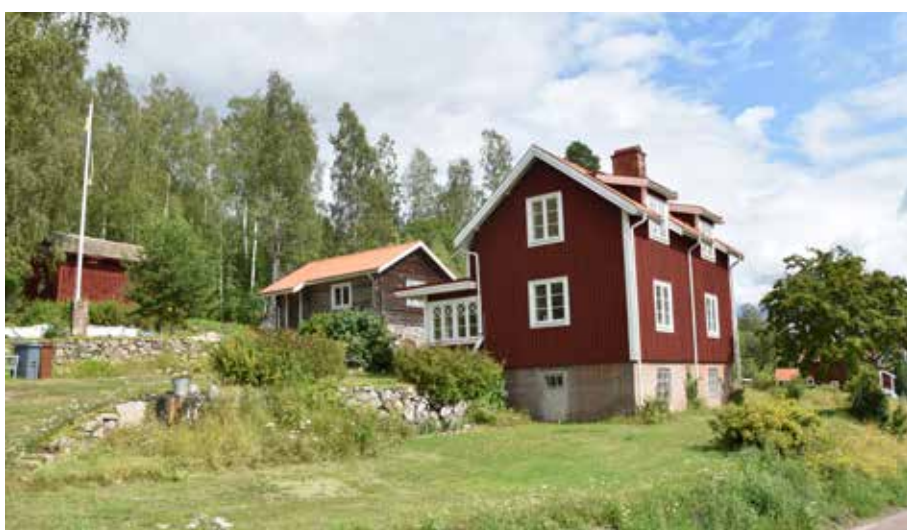
Ålderdomlig timmerstomme och nyare bostadshus i södra delen av byn. På grund av sluttningläget har många byggnader i byn höga socklar. Berg 10:1.