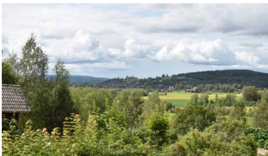
Utsikt från norra delen av byn mot Ullvi och Vändattberget.