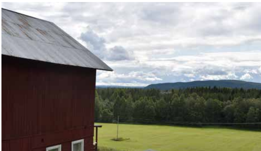
Bebyggelsen i Berg är belägen högt, på en sluttning ovanför odlingslandskapet.