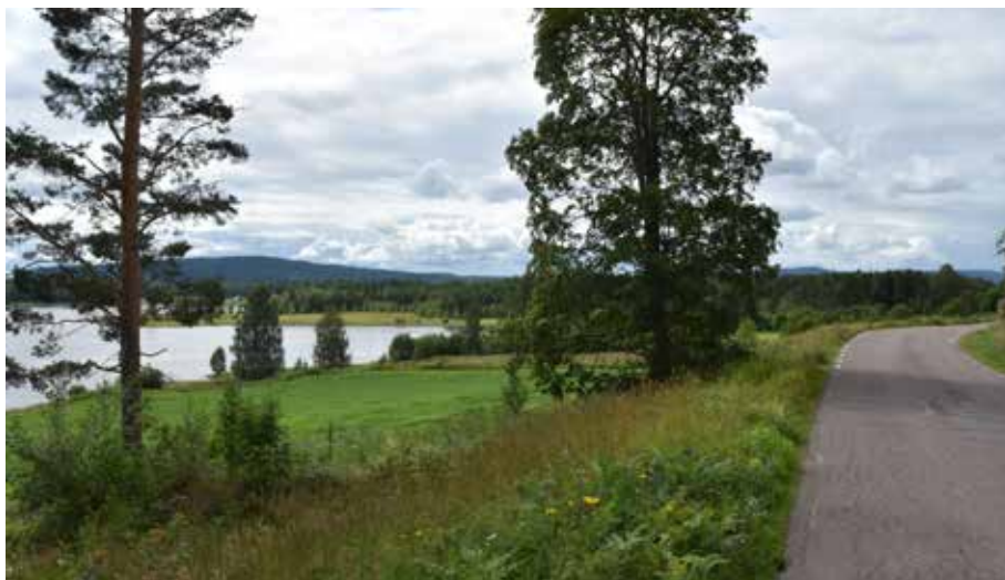
Det öppna och hävdade odlingslandskapet vid Österdalälvens utlopp i Insjön. Landsvägen löper över Bergsbergets sluttning.