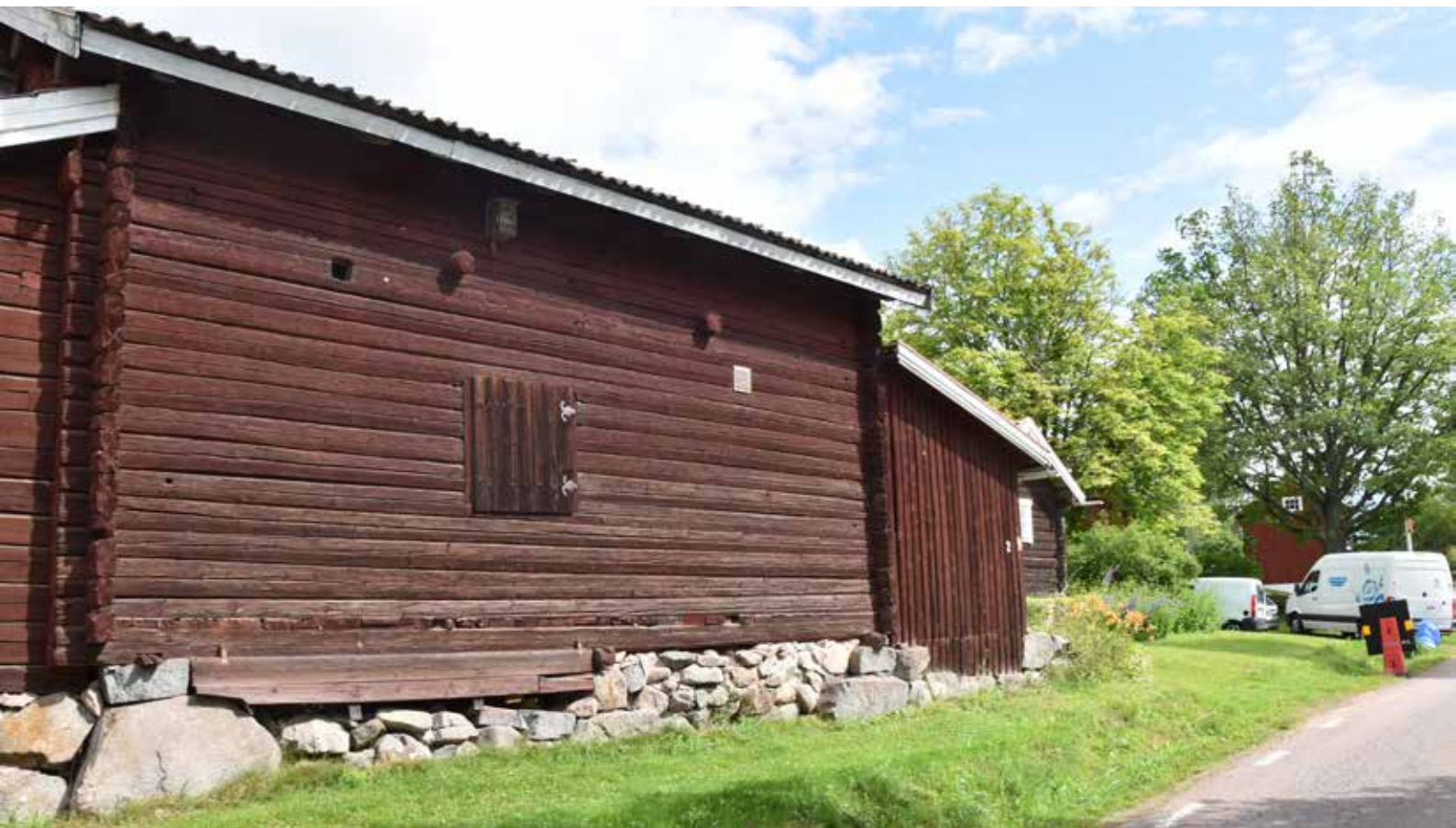
Tröskloge i timmer av relativt hög ålder i den norra delen av byn. Berg 5:7.

Kringbyggd gård med ålderdomliga timmerhus. längst upp från vänster: hölada, parstuga (bostadshus), långsideshärbre, källarstuga, loftbyggnad med portlider, vagnsbod sammanbyggd med kortsideshärbre, tröskloge, brunn, stall, torkhus, smedja, lada och fähus med portlider och dyngstad.