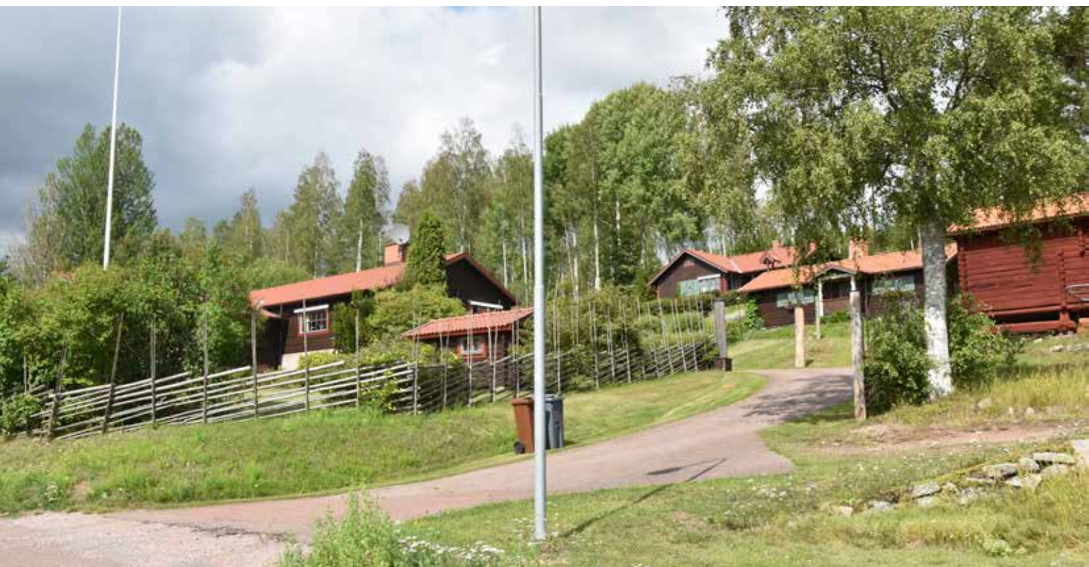
En samlad grupp av modernistiska timmerhus i sluttningsläge. Byggnaderna är sannolikt från 1960- och 1970-talen. Berg 6:4 samt 6:10.