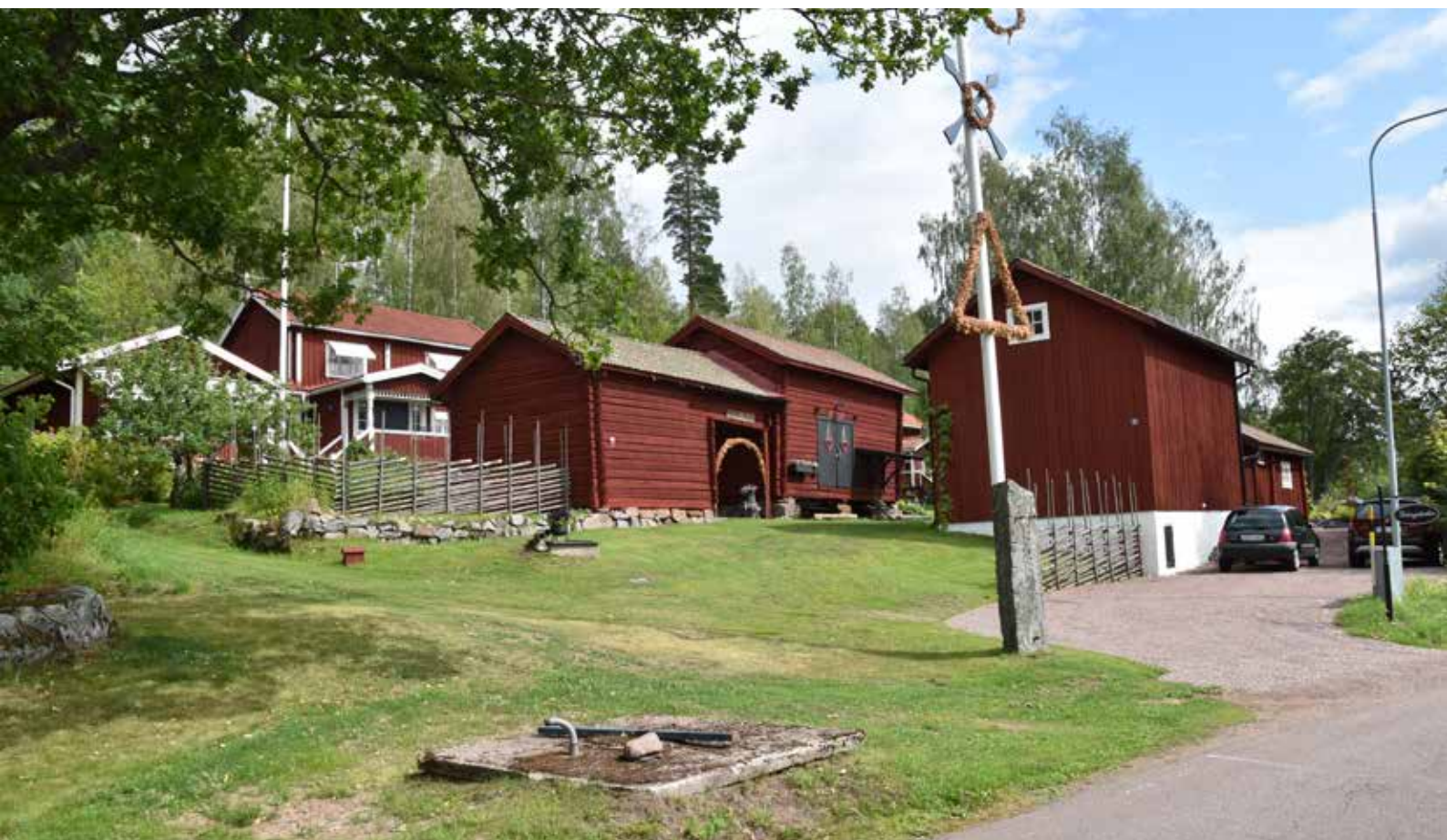
Vissa gårdstun i byn är delvis kringbyggda. Även om byggnaderna förändrats är strukturen intressant och värdefull. Berg 1:5.