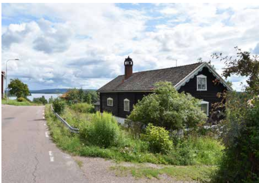
Timmerhus från den moderna epoken, sannolikt uppfört under 1940-talet. Byggnaden är ett värdefullt exempel på hur detaljer typiska för nationalromantiken, eller dalaromantik, levde kvar länge i Dalarnas byar. Berg 6:5.