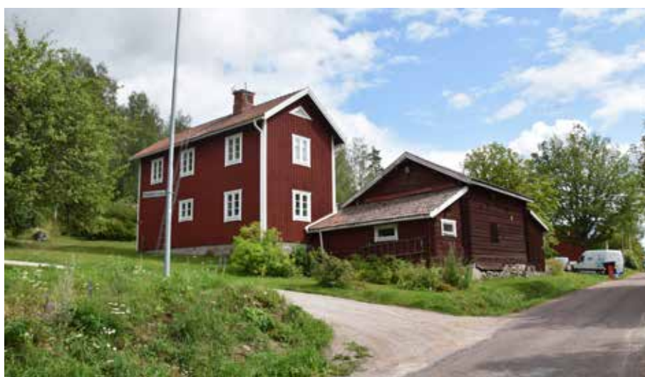
Delvis kringbyggd gård med utbyggt bostadshus i två våningar. Berg 5:7.