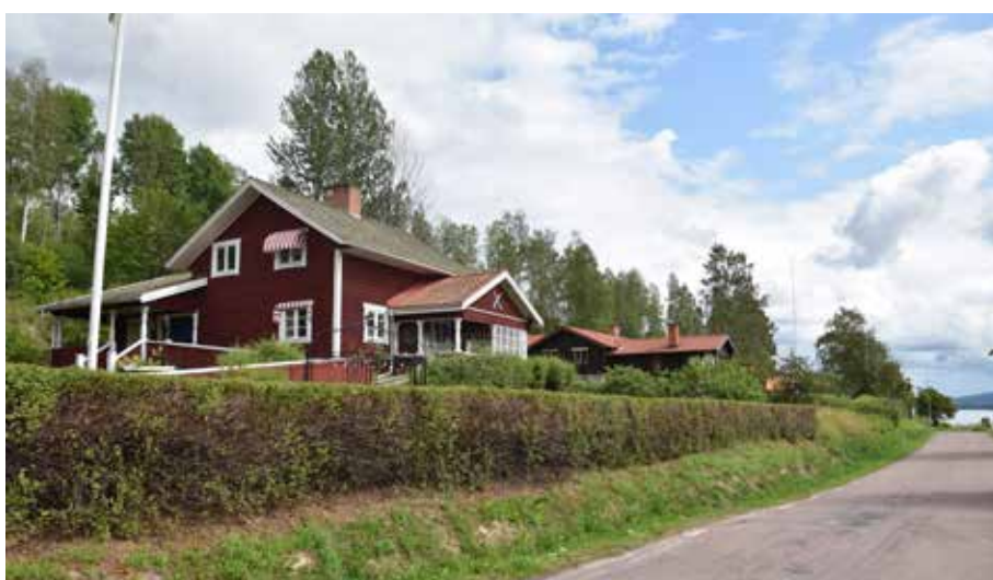
Många äldre byggnader har ombyggt och utbyggt under 1900-talet och 2000-talet. Berg 7:4.