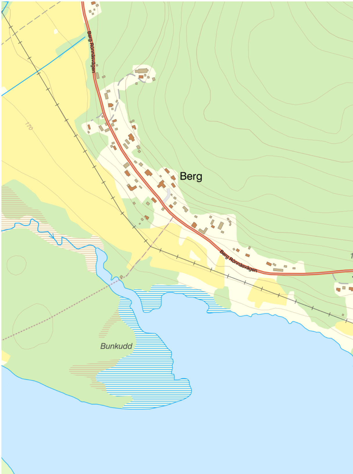
Berg är en radby belägen i sluttningsläge norr om Österdalälvens utlopp i Insjön. Karta, Lantmäteriet.